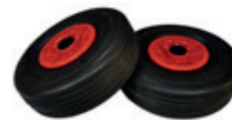
Set lekvrije zwenkwielen