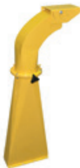
Hoge draaibare uitwerpbuis