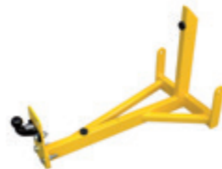
Hef-kit voor aanhangwagen