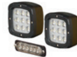
Werkverlichting - set