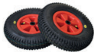
Set lekvrij wielen