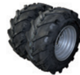
Set dubbele wielen